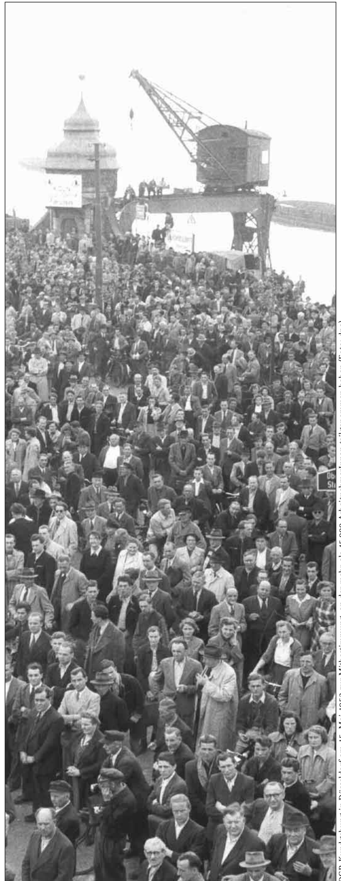
DGB-Kundgebung in Düsseldorf am 15. Mai 1952 zur Mitbestimmung, an der mehr als 45.000 ArbeitnehmerInnen teilgenommen haben

Die so auf die Mitwirkung im Betrieb und Unternehmen reduzierte Mitbestimmung ist unvollkommen. Nicht nur, dass Verbindlichkeit und Reichweite der gesetzlichen Mitbestimmungs-